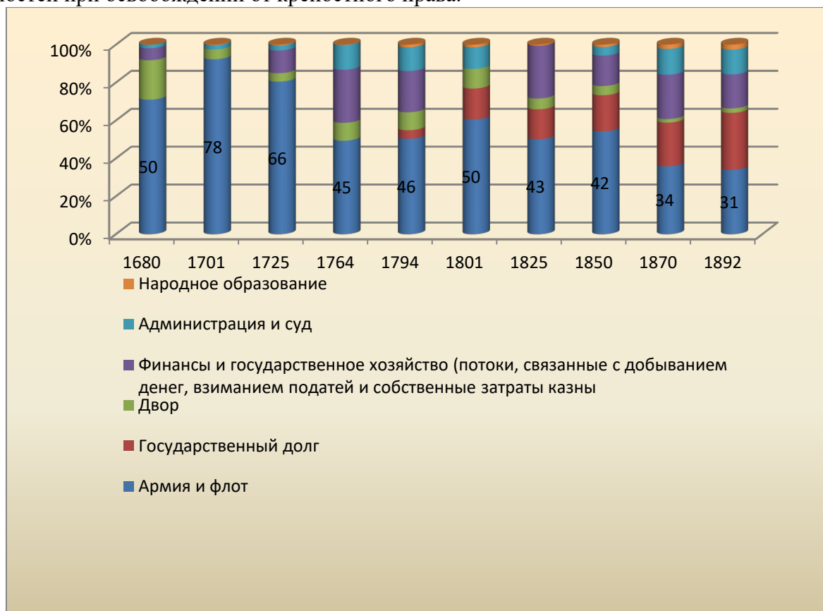
Рис. 1. Гистограмма структуры расходов в Российском государстве

Государственный долг в эти периоды выступал в виде государственных займов, которые были необходимы государству для покрытия издержек на ведение войн. Исключением являлись займы на строительство железных дорог и выкуп крестьянских повинностей при освобождении от крепостного права.